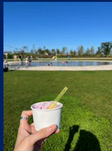
はなふるで人気の ジェラートを楽しむ