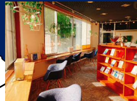
お風呂カフェでまったり