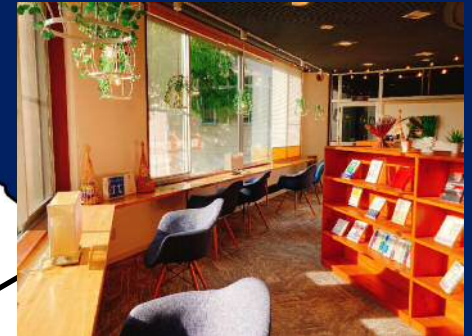
おふるCafeでまったり