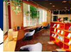
お風呂カフェでまったり