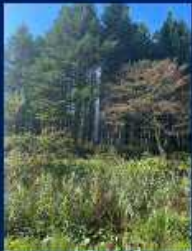
急に温泉が噴き出した！！謎の噴水