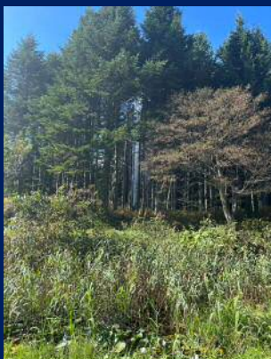
急に温泉が噴き出した！！謎の水柱