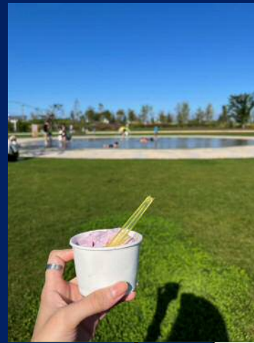
はなふるで人気の ジェラートを楽しむ