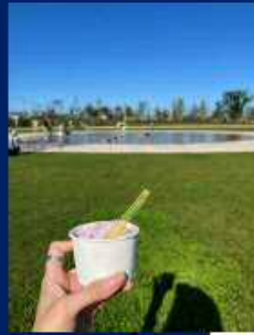
はなふるで人気の ジェラートを楽しむ